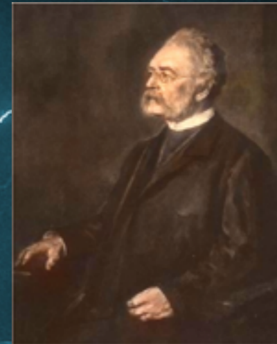
Werner von Siemens